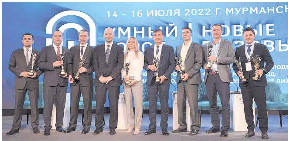
Представители топ-10 городов – победителей конкурса