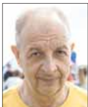
Максим Ряшин, Глава Ханты-Мансийска:

– Мое участие связано с тем, что я начал помогать команде в организации этого заплыва. Это