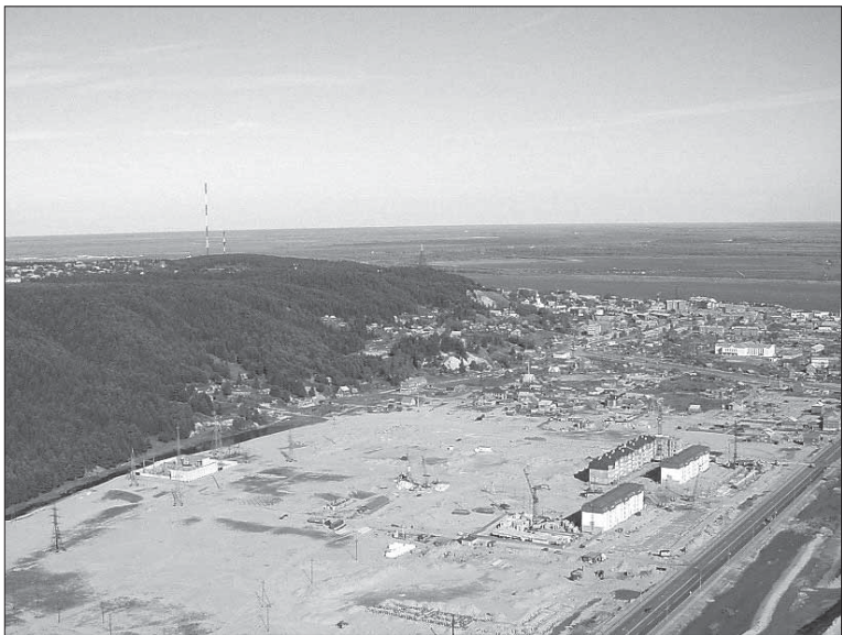
Начало застройки Гидронамыва