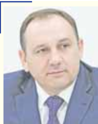
Глава города Ханты-Мансийска Максим Рышин:

Уверен, что недалек тот день, когда заживут полнокровной жизнью еще два перспективных жилых микрорайона – «Западный», поселок Солнечный, который по привычке и в память о строителях называют СУ-967 и «Восточ-