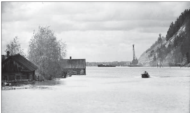
Здесь сейчас Археопарк