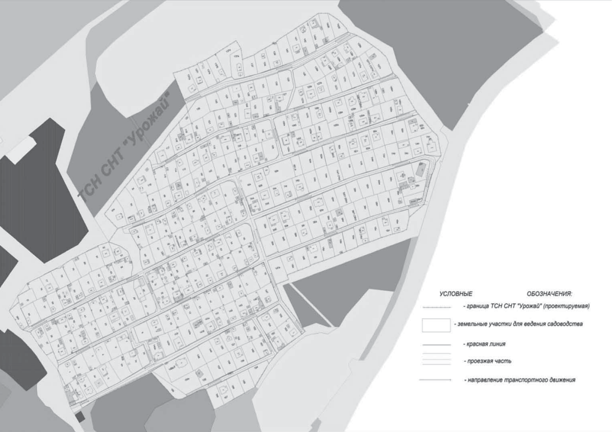
Схема вертикальной планировки и инженерной подготовки территории