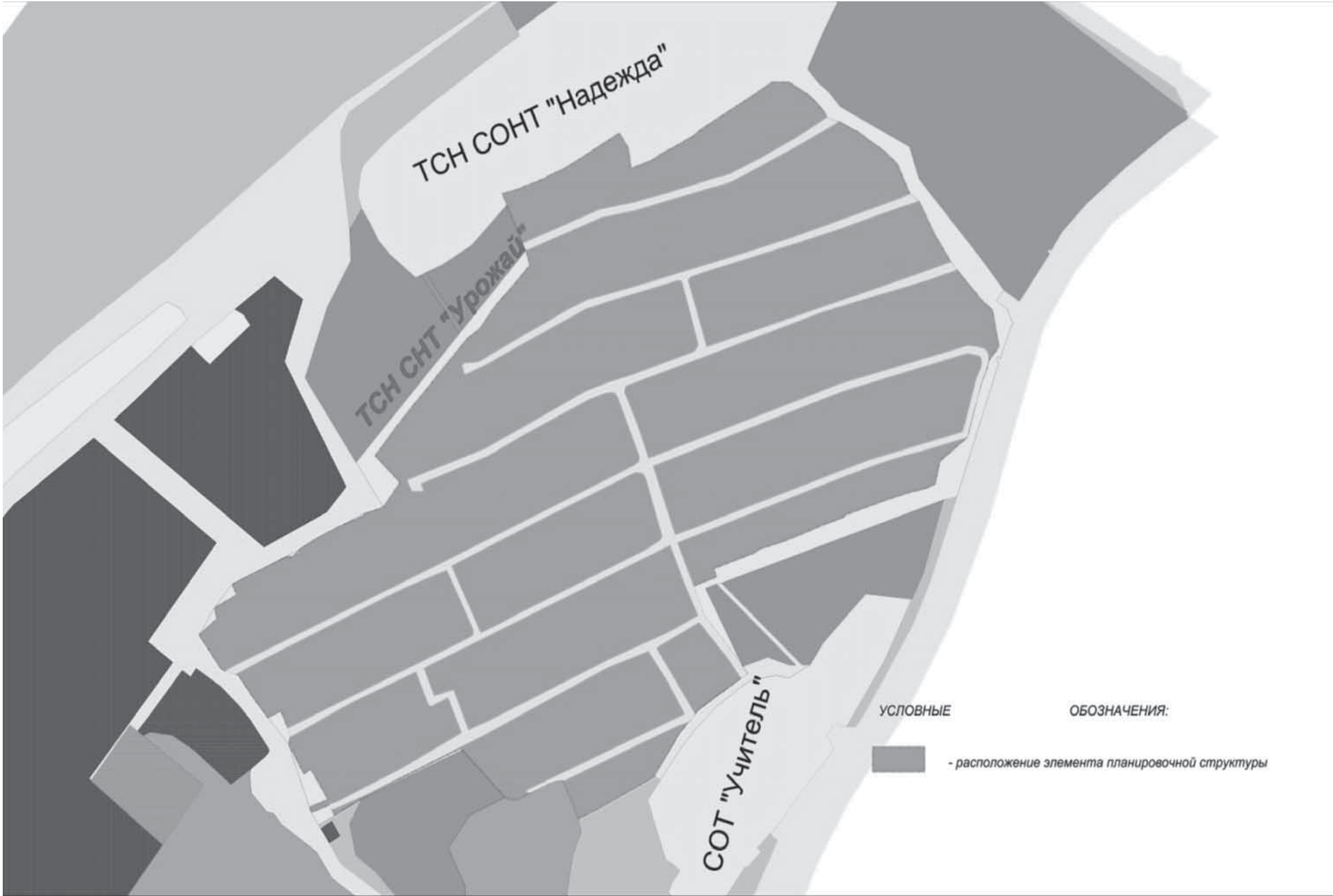
Схема использования территории в момент подготовки проекта планировки территории

Схема расположения элемента планировочной структуры