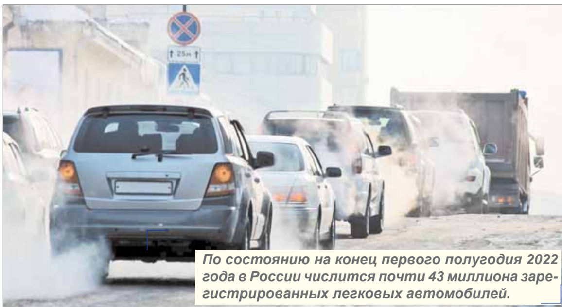
По состоянию на конец первого полугодия 2022 года в России числится почти 43 миллиона зарегистрированных легковых автомобилей.

22 сентября – Всемирный день отказа от автомобиля. Суть праздника заключается в пропаганде «антиавтомобильного» способа передвижения. Многие страны с удовольствием присоединяются к акции, чтобы насладиться прогулкой на самокатах, велосипедах или роликах. А можно и вовсе отправиться в путь на своих двоих. Мы узнали, насколько хантымансийцы привязаны к своим автомобилям и как бы они обходились без своего «любимца» хотя бы один день.