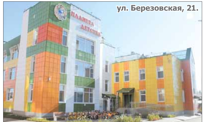
ул. Березовская, 21.