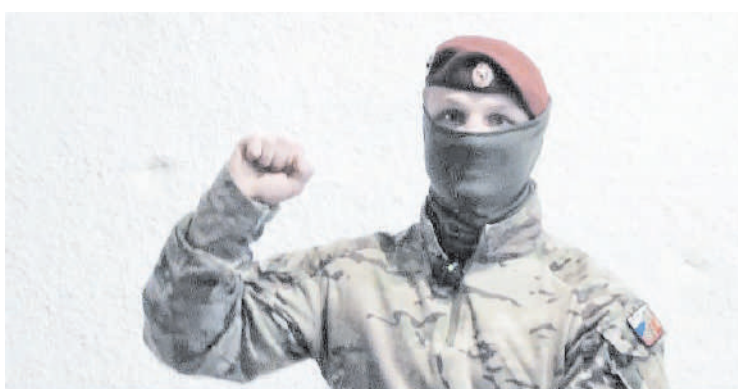
Бойцы обеспечены продуктами, всем необходимым. Передают привет семьям – родителям, супругам, детям

Сейчас Росгвардия работает с полицией, наркоконтролем. Из недавних случаев «Дантист» выделяет два – это задержание наркосбытчика,