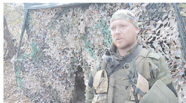
«Огонек»: «Никто не пасует, все понимают, для чего это проводится. А на позициях все ведут себя мужественно»

ФАКТ: БОЙЦЫ ИЗ ЮГРЫ ПОЛУЧАТ РЮКЗАК С ДОПОЛНИТЕЛЬНЫМ ОБОРУДОВАНИЕМ