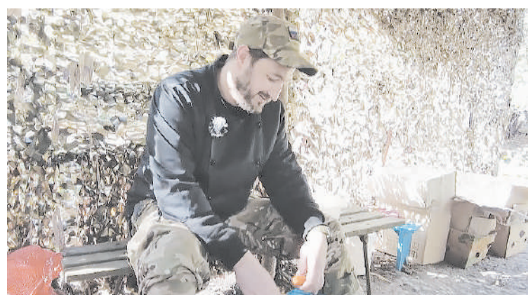
По обедам в «Немане» главный – боец с позывным «Ермак»

Мы уже писали об отдельном стрелковом батальоне «Неман», успешно решающем боевые задачи в зоне специальной военной операции. Но война – это не только штурмы и оборона, не только разведка и укрепление позиций. Солдаты не киборги – они люди, которым нужен быт. А обустроенный быт на передовой – залог успеха в бою.