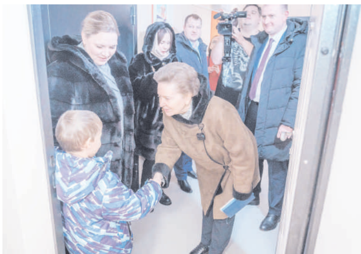
Новую квартиру в рамках договора социального найма получила семья военнослужащего из Пыть-Яха. Глава региона Наталья Комарова посетила новосёлов во время рабочей поездки в город

Также вне очереди предусмотрено переселение семей участников спецоперации