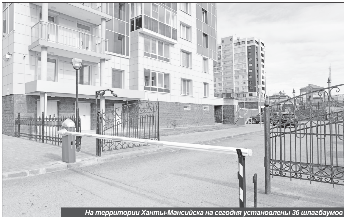
На территории Ханты-Мансийска на сегодня установлены 36 шлагбаумов