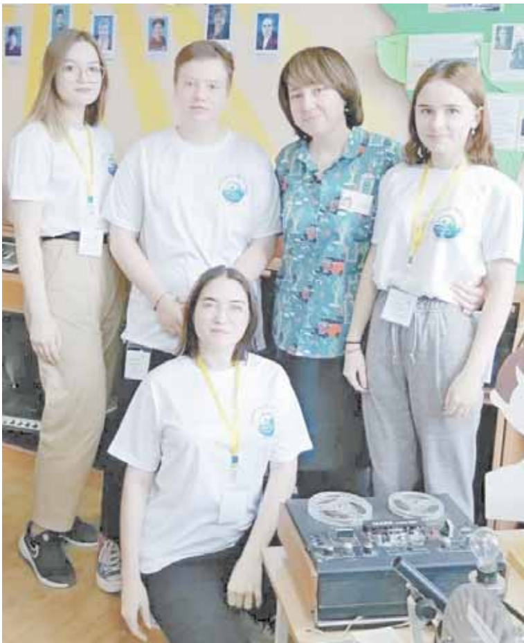
Завершить работу над первой книгой «Флора Югры» планируется к лету, после чего ребята приступят ко второй – «Фауна Югры»

С этой темой команда планирует выступать на конкурсах школьного и городского уровня, а также найти спонсорскую поддержку, чтобы была возможность после завершения работы над книгой выпустить ее массовым тиражом.