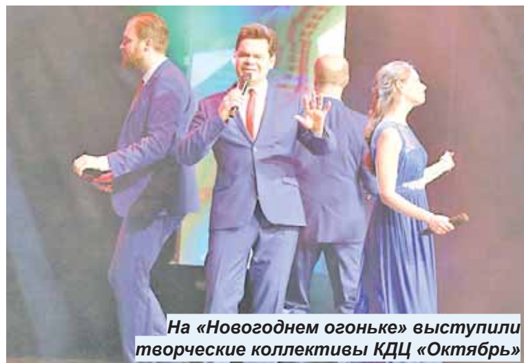
На «Новогоднем огоньке» выступили творческие коллективы КДЦ «Октябрь»