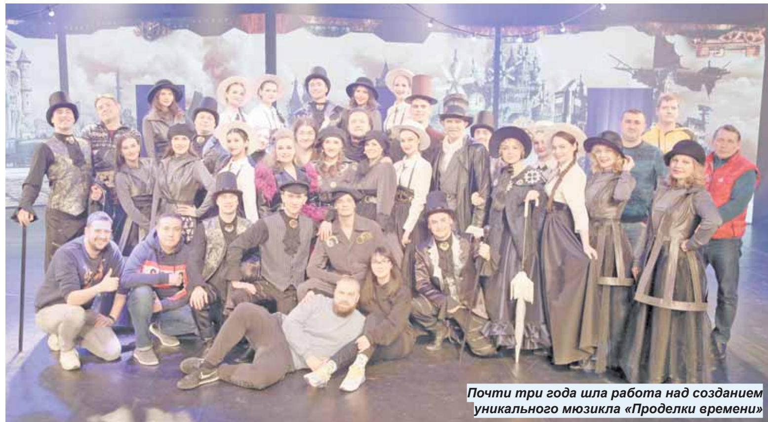
Почти три года шла работа над созданием уникального мюзикла «Проделки времени»

Это первый подобный проект в истории Ханты-Мансийска. Развлекательная и в то же время поучительная история будет интересна широкому кругу зрителей: