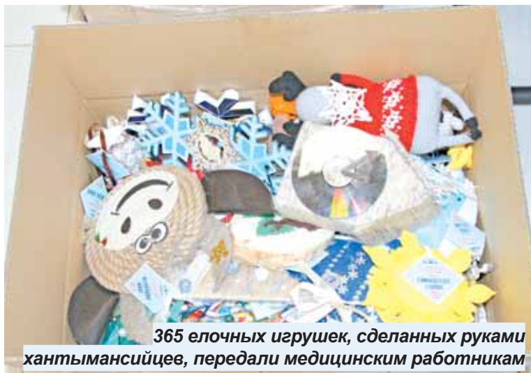
365 елочных игрушек, сделанных руками хантымансийцев, передали медицинским работникам

«Родители вместе с детьми каждый год участвуют в акции и делают эти волшебные игрушки. Обычно мы украшаем ими елочки, но в этом году решили порадовать наших медицинских работников. Они у нас герои этого года! В этом году получилось создать почти 400 игрушек. Именно столько детей вместе со своими родителями делают игрушки и радуют много хороших, добрых людей. Вручили медикам 365 по-