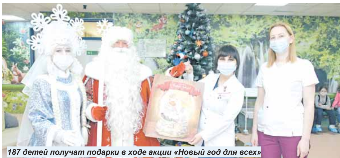
187 детей получают подарки в ходе акции «Новый год для всех»

В этом году площадкой для сбора подарков детям, которые