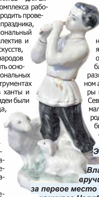
Эту фарфоровую статуэтку

На сайте Окружного Дома народного творчества я не нашел ни строчки о легендарном ансамбле «Хорам». А вот что разместил в электронном архиве Центр культуры и искусства народов Севера: «В 1973 году в маленьком северном городке Ханты-Мансийске был создан ансамбль «Хорам». Его созда-