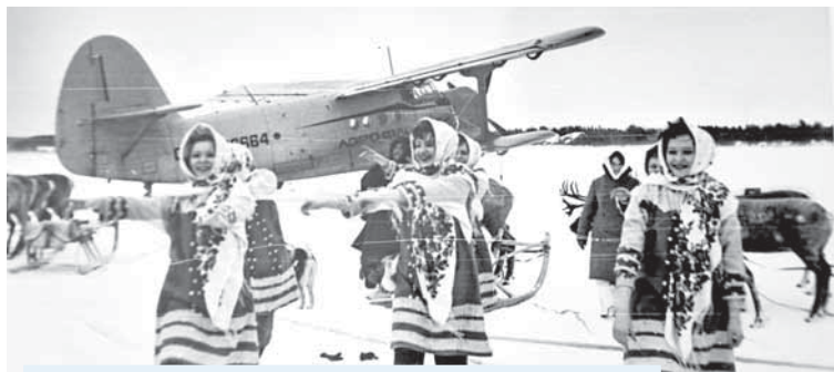
Ансамбль «Хорам» был создан в 1973 году

стратегически важнейшую задачу — начать работу по сохранению и возрождению древней культуры, традиций и обычаев коренных народов Севера. По его указанию меня отправили в поездку по всей территории округа изучать древние традиции народов ханты и манси. И практически весь семьдесят четвертый год я мотался по национальным поселкам и стойбищам, скрупулезно изучал, записывал, зарисовывал да просто запоминал все, что было связано с танцевальным искусством и фольклором ханты и манси.