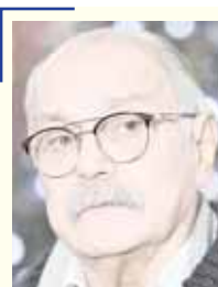
Никита Михалков, кинорежиссер:

В России поняли, что перед страной в этих обстоятельствах возникла прямая угроза уничтожения государственности.