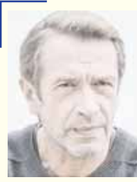
Владимир Машков, актер, режиссер:

– Я считаю, что это был единственный возможный выход из тупиковой ситуации. Череда предательств со стороны Украины и наших западных «партнеров» превысила все допустимые нормы. В течение восьми лет мир спокойно взирал на то, как просто и безнаказанно убивают невинных граждан только за то, что они не хотели признать пришедший путем путча нацистский режим... Я считаю, что произошедшее – это ярчайшее подтверждение того, что Россия сохранила собственное достоинство, несмотря на то, что столько лет нас пытались его лишить, и мы в этом, к сожалению, порою сами принимали немалое участие.