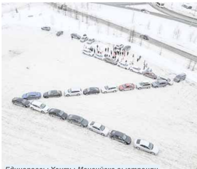
Единогорцы Ханты-Мансийска выстроили автомобили в латинскую букву «Z» в знак поддержки решения Президента России помочь жителям Донбасса

Поэтому Россия выдвинула ряд предложений: