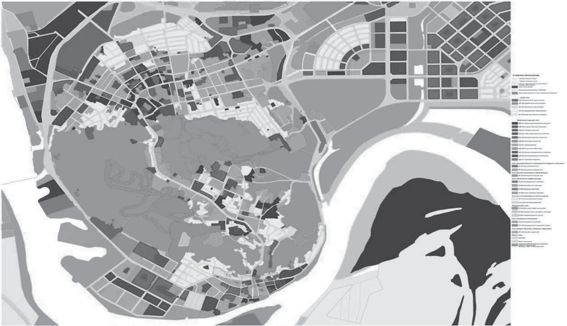
Список объектов культурного наследия расположенных в городе Ханты-Мансийске