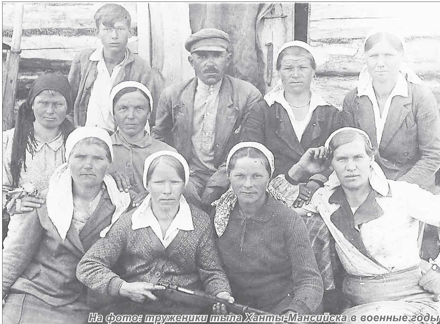
На фото: труженики тыла Ханты-Мансийска в военные годы