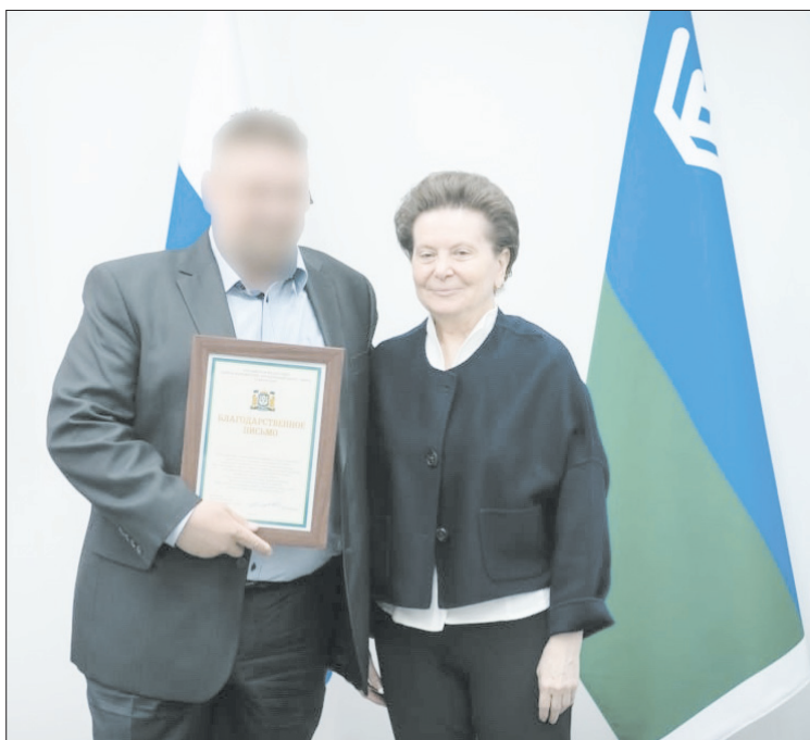
Глава региона торжественно вручила благодарственные письма от своего имени участникам СВО и жителям региона

средств реабилитации, приобретение которых финансируется из средств окружного бюджета.