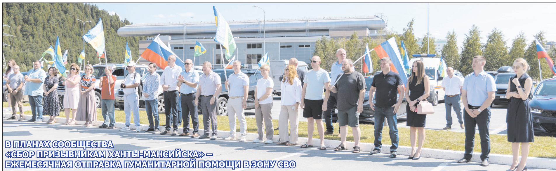
В ПЛАНАХ СООБЩЕСТВА «СБОР ПРИЗЫВНИКАМ ХАНТЫ-МАНСКИЙСКА» — ЕЖЕМЕСЯЧНАЯ ОТПРАВКА ГУМАНИТАРНОЙ ПОМОЩИ В ЗОНУ СВО