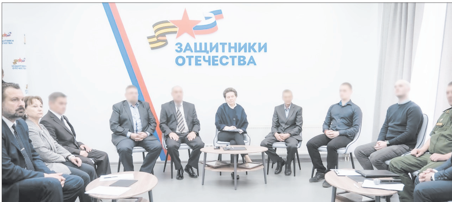
Губернатор отметила, что постоянно находится на связи с родными участников специальной военной операции, которые обращаются к ней с различными инициативами и предложениями

Глава региона также сообщила о планах по предоставлению участникам СВО, получившим инвалидность вследствие военной травмы, специальных автомобилей. Такой транспорт будет включен в перечень технических