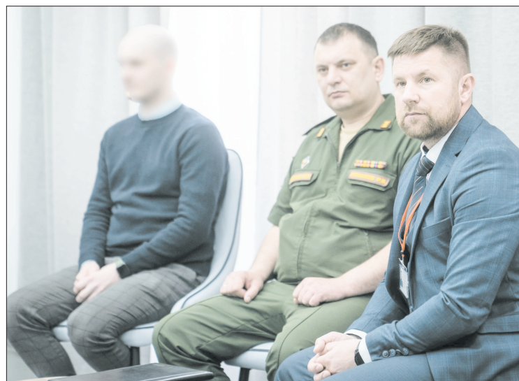
Участники отметили важность сохранения памяти о погибших

— Правительство Югры работает в этом направлении. Департаменту здравоохранения