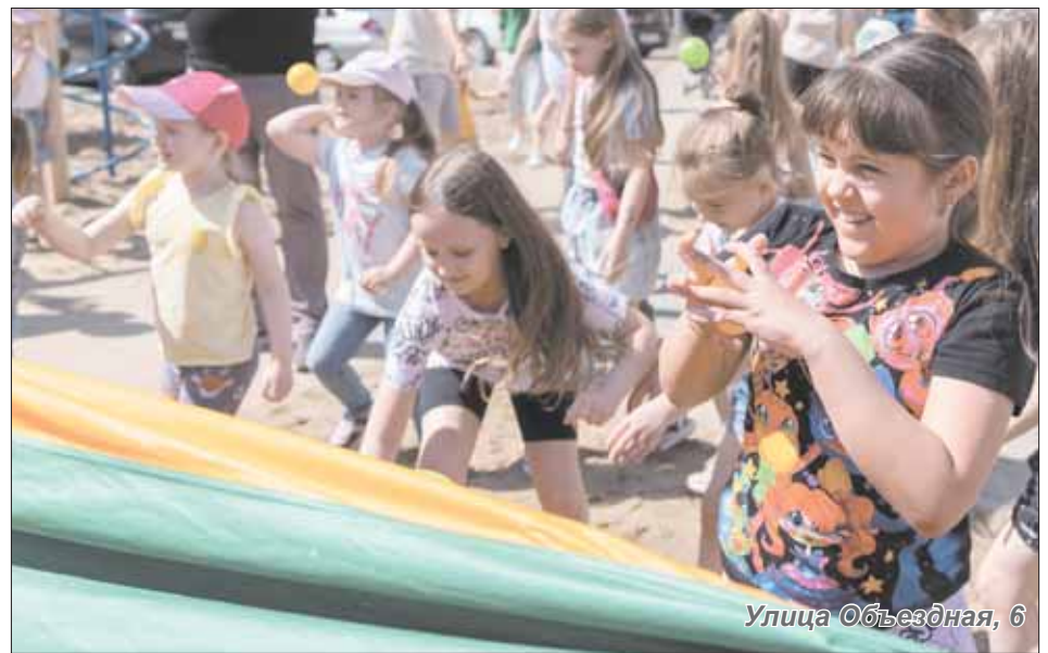
Улица Объездная, 6