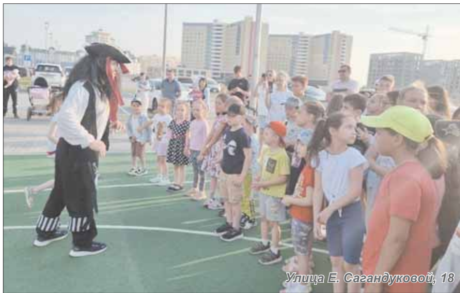
Улица Е. Сагандуковой, 18