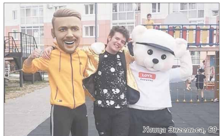
Улица Энгельса, 60

ВСЕГО «ПРАЗДНИКИ ДВОРА» ПРОВЕЛИ 5 УПРАВЛЯЮЩИХ КОМПАНИЙ. УЧАСТИЕ В НИХ ПРИНЯЛИ ПОРЯДКА 400 ЖИЛЬЦОВ.