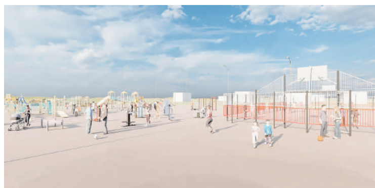
Пустырь может стать местом спокойного и активного отдыха

ной площадки, тренажеров, лавочек для отдыха и игровых зон для малышей, предполагается провести озеленение этой территории. Если наш проект не победит в общегородском голосовании, мы продолжим благоустройство своими силами. Будем участвовать в инициативных проектах, подавать заявки на гранты различного уровня, – отмечает он.