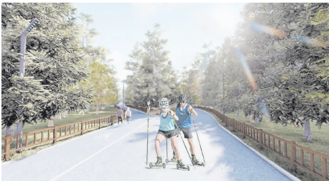
В «Долине ручьев» создадут новую инфраструктуру и профессиональные спортивные трассы