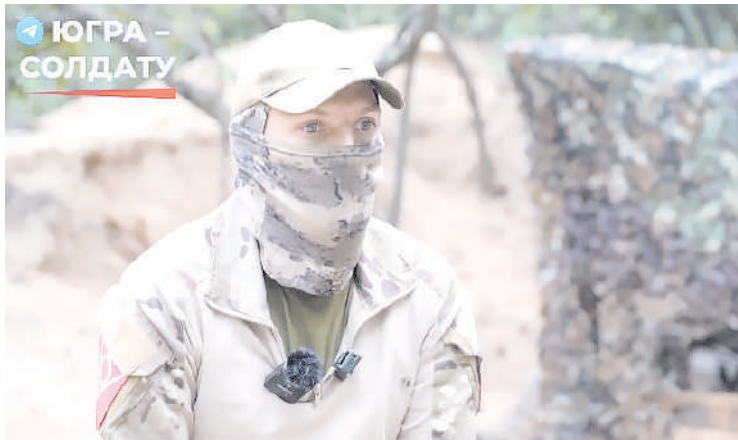
Рассказывая об обстоятельствах награждения третьим орденом Мужества, называет себя полным кавалером этой награды

В тот день, когда была проведена знаменитая операция, он часть бойцов отправил по пробитому в трубе проходу, а сам с группой пошел в условиях глубокого тумана поверху. Говорит,