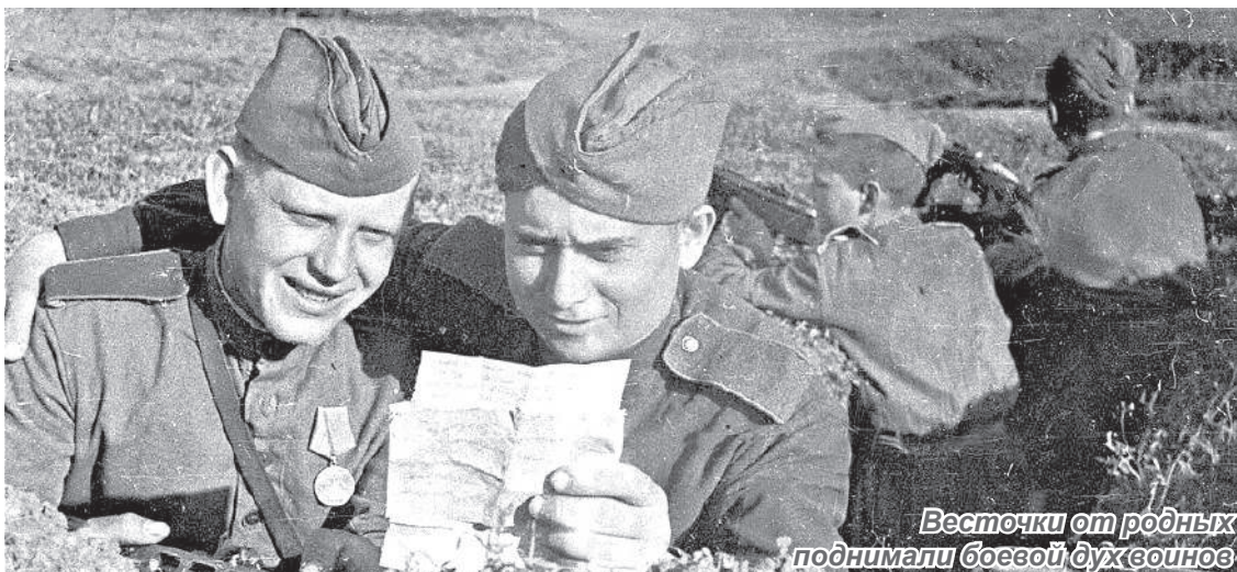
Весточки от родных поднимали боевой дух воинов

В начале сентября 2023 года окружной столице присвоен статус «Города трудовой доблести». Чтобы сохранить память о людях, которые своим трудом ковали Победу, городской архив собирает личные документы ветеранов трудового фронта Ханты-Мансийска.