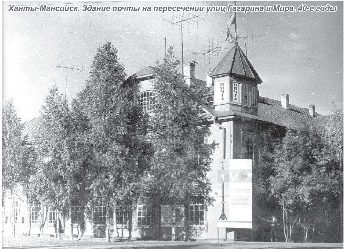
Ханты-Мансийск. Здание почты на пересечении улиц Гагарина и Мира. 40-е годы