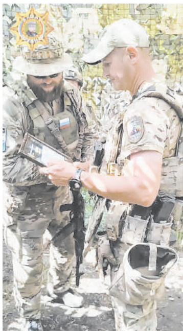
Югорчане набрались необходимого опыта в кратчайшие сроки

Учебное заведение было основано в августе 2013 года по предложению Рамзана Кадырова. Изначально оно называлось «Международный учебный