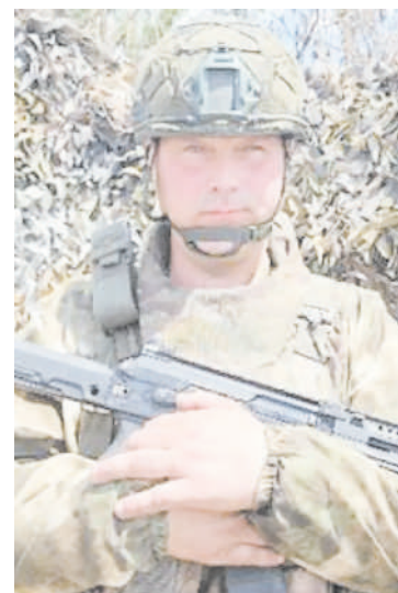
ты, выпускаемой в подразделениях Центрального военного округа ВС РФ.

Героизм нашего земляка стал темой очередного выпуска боевого листка группировки войск «Центр», солдатской стенгазе-