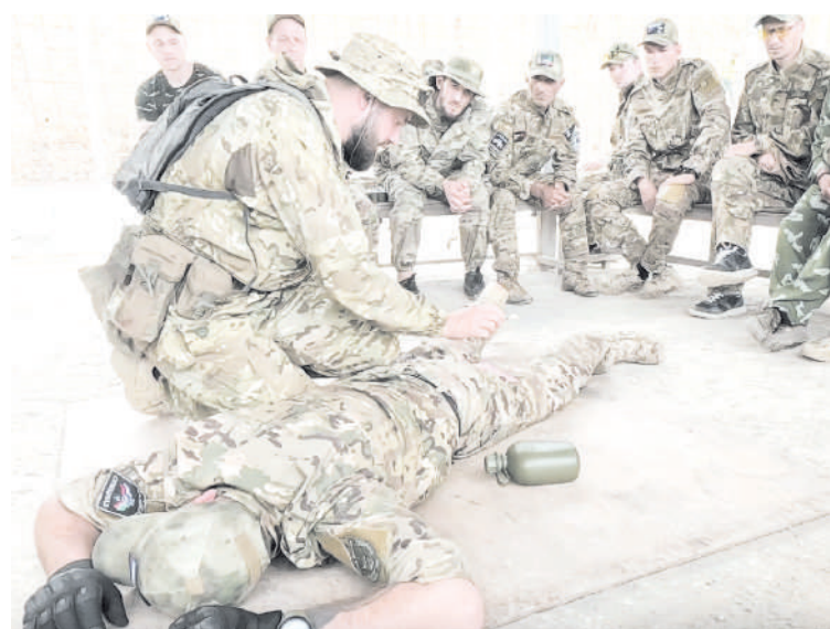
В «Ахмате», говорят, за 10 дней учат профессионально стрелять, штурмовать в городской черте, а главное, беречь жизни бойцов

Как потом оказалось, злоумышленник в 2014 году, бросив мать, уехал из Днепропетровска в Россию. Несмотря на все доказательства своей вины, он пытался все отрицать, но уже вскрылся и второй эпизод. Следствие работает.