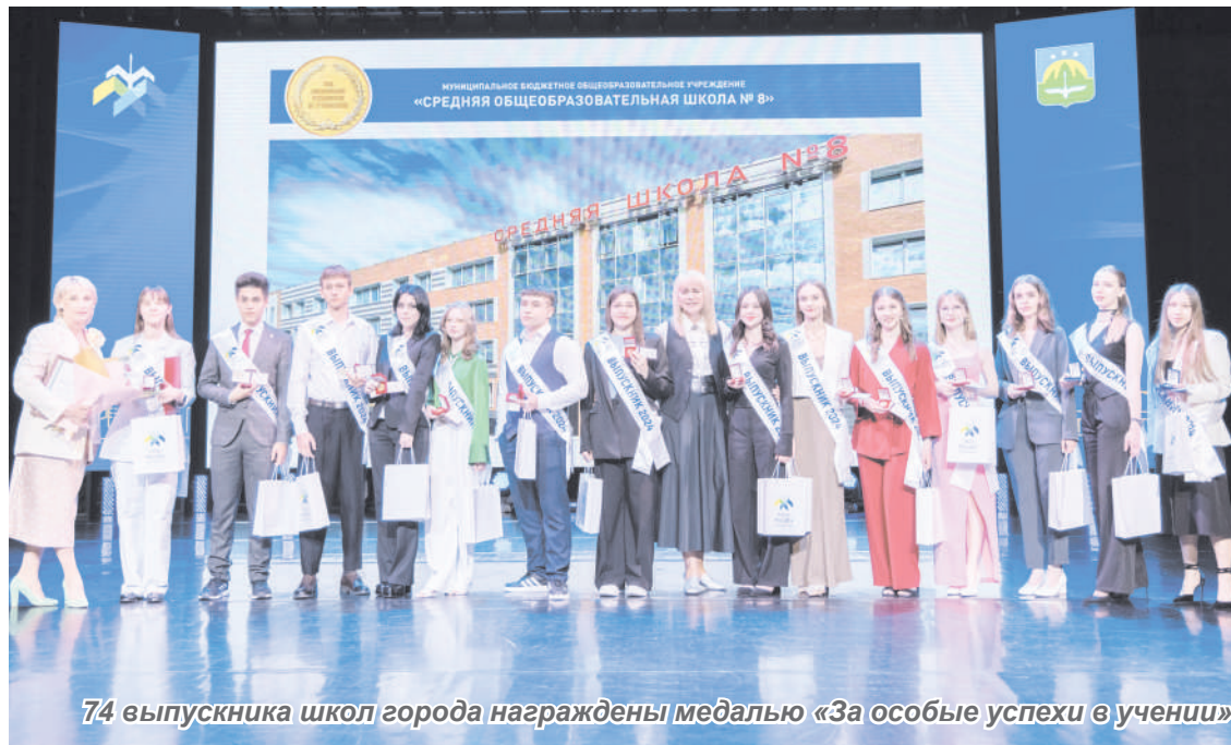
74 выпускника школ города награждены медалью «За особые успехи в учении»

300 студентов Югорского госуниверситета в этом году получили дипломы с отличием. Среди них будущие специалисты по нефтегазовому делу, электроэнергетике, юриспруденции