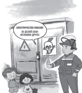
ОПАСНО ВЛЕЗАТЬ В ТРАНСФОРМАТОРНЫЕ БУДКИ