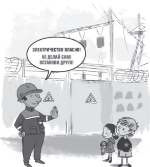
ОПАСНО ЗАПЕЗАТЬ НА ЭНЕРГООБЪЕКТЫ. ЕСЛИ ЗАГОРИТСЯ ЭЛЕКТРОПРИБОР, ЗВОНИ 101!