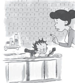
ОПАСНО ПРИКАСАТЬСЯ К ЭЛЕКТРОПРИБОРАМ МОКРЫМИ РУКАМИ