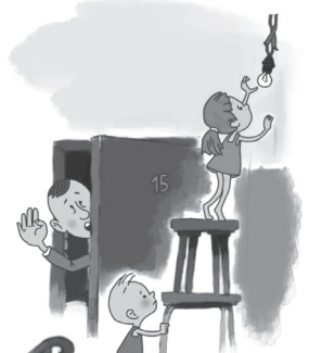
ОПАСНО САМОСТОЯТЕЛЬНО РЕМОНТИРОВАТЬ ПРИБОРЫ