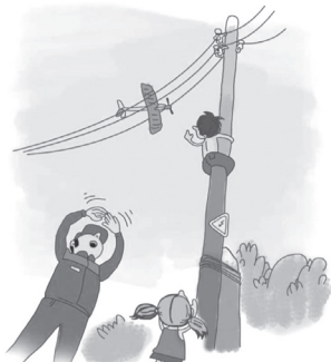
ОПАСНО ИГРАТЬ ВБЛИЗИ ЛИНИЙ ЭЛЕКТРОПЕРЕДАЧ