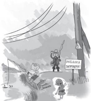
ОПАСНО РЫБАЧИТЬ ПОД ЛИНИЯМИ ЭЛЕКТРОПЕРЕДАЧИ