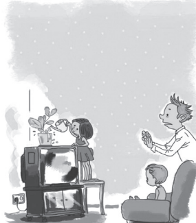
ОПАСНО ИСПОЛЬЗОВАТЬ ЭЛЕКТРОПРИБОРЫ РЯДОМ С ВОДОЙ