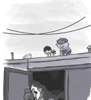
ОПАСНО ИГРАТЬ ВБЛИЗИ ПРОВОДОВ