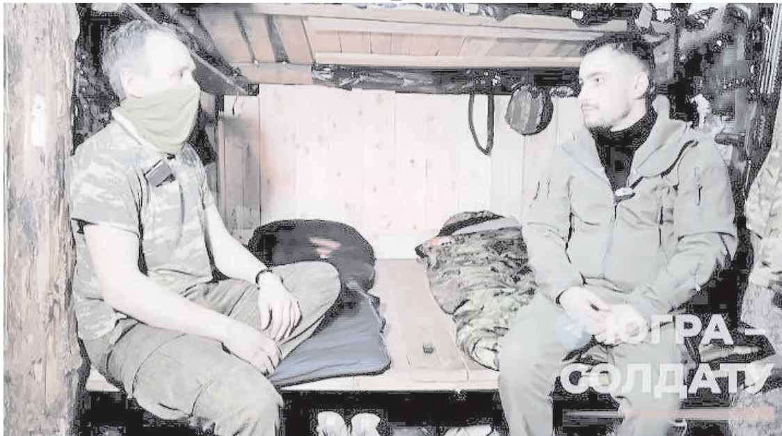
Во время одного из заданий боец увидел «глаза» противника – разведдрон ВСУ был прямо над головой

Речь о дронах противника – возможно, наибольшей опасности в ходе этой войны.