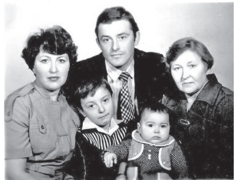
Семья Егоровых, 1981 год